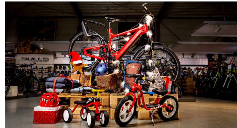
Die besten Weihnachtsgeschenk-Ideen rund ums Fahrrad gibt's bei Flizz EUROBIKE

Flizz EUROBIKE ist in Aachen und der Euregio der Fahrradfachhandel mit konstant hoher Qualität bei Fahrrädern und Beratung – und aktuell mit bestens aufgestellter Lagersituation.